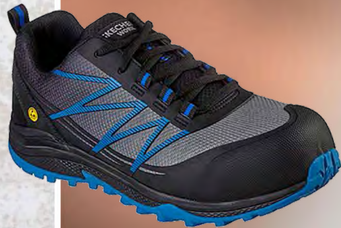
REF. SK200046EC PUXAL COMP TOE