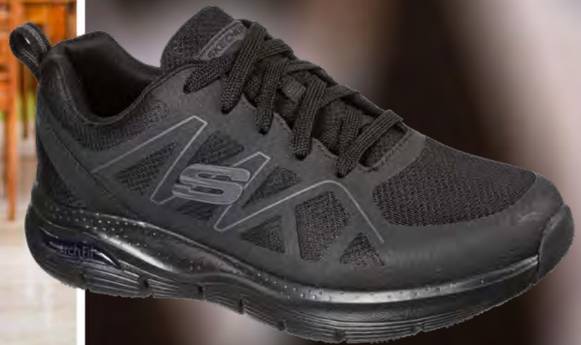
SK200025EC ARCH FIT SR - AXTELL