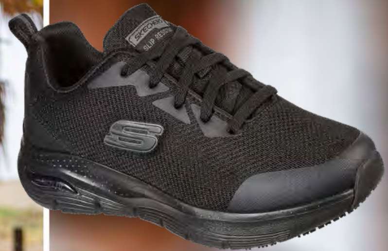
SK108019EC ARCH FIT SR