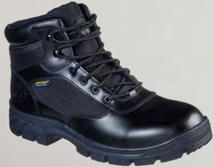
REF. SK77526EC WASCANA - BENEN WP