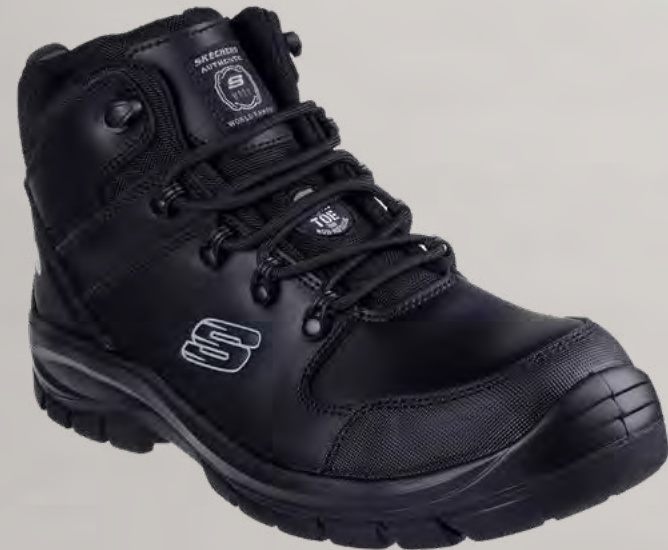
REF. SK200187EC TROPHUS - PENDING