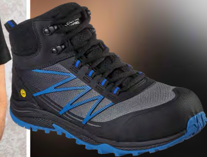
REF. 200047EC PUXAL FIRMLE